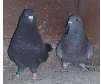
Huhn und Titan im Lebenshof – wohin nun?